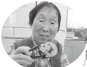
美味しそうです。 いただきます。