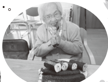
こんなに沢山!! しあわせです。