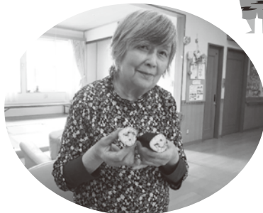
みてみてこんなに 上手にできました。

4日は、一丁目『令和はオニギラズでオニイラズ』と企画し、恵方巻きでもなく、おにぎりでもない、「おにぎらず」を皆で作りました。初めてのメニューに「何ができるのだろう？」と興味深々。食べる時にそれぞれが「おにぎらず」を切り、鬼を断ち切りました。「おにぎらず、初めて食べただけ美味しかった。」と言われ、今後のグループホームのメニューに加わりそうです。