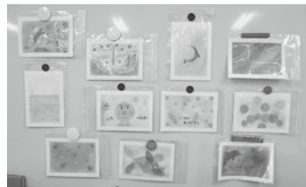
完成した作品です。(パステルアート)