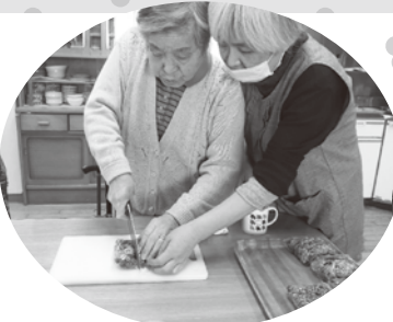
さ〜て、切ったら どうなるの？