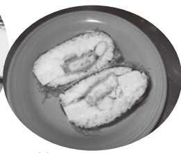
美味しそうに 「おにぎらず」 カラーでないのが 残念です。