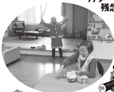
今年も鬼が やってきた!!

グループホームでは、2月3日、4日に、各ユニットで節分行事をおこないました。3日は、二丁目と三丁目合同で昼食用に巻き寿司を作り、会食。午後からはそれぞれの居室に豆まきをし、厄払いと一年の健康を祈りました。