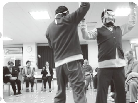
紙豆をおもいつきり鬼へ