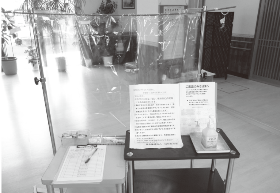
施設玄関：おねがい文書掲示（検温、マスク着用、手指消毒、名簿記載など）