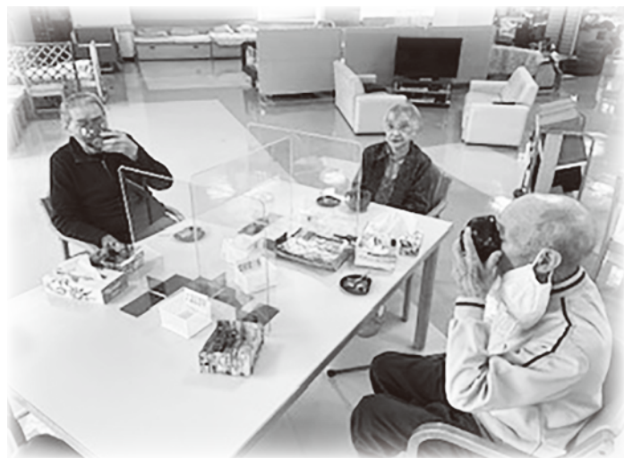
食堂用テーブル：利用者さんも一定の距離を保ちパネル越しに座っていただいています。