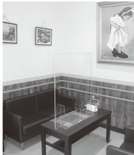
面談コーナー：パネル設置

山形虹の会での新型コロナウイルス感染症対策は、感染症の発生段階（フェーズ）毎の対応、利用者及び職員に感染者・濃厚接触が発生した際の対応と職員に自待機の必要性が発生した時の具体的な取り組みや連絡方法を記載したマニュアルを整備し、全職員への周知を行っています。日常的には、特に面会では施設に入る前の検温、マスクの着用、手指消毒、名簿への記載、短時間で他者との接触を極力避ける場所での面会を行っています。