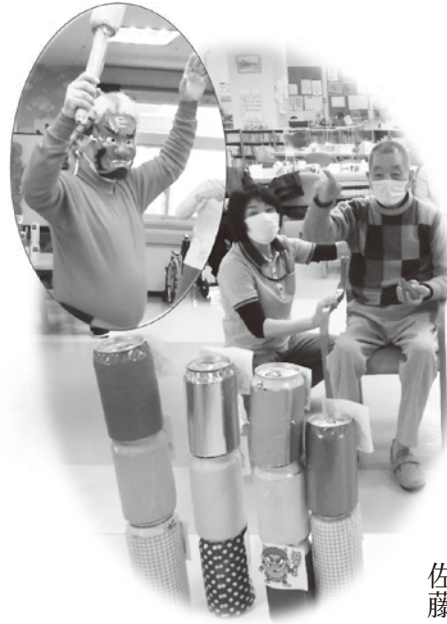
鬼は外! 缶倒しゲーム

二月二日、三日、デイケアで節分行事を実施。今年も、新型コロナウイルス予防のため、マスク着用とソーシャルディスタンスを保ち「無病息災」「健康に暮らせるように」と豆を撒きました。豆は、利用者さんが紙で手づくりし、鬼たちに「鬼は外」「福は内」と元気なかけ声とともに投げつけ、鬼たちは命からがら逃げたのも束の間、その後行われた「鬼は外! 缶倒しゲーム」大会のアシスタントに大活躍、