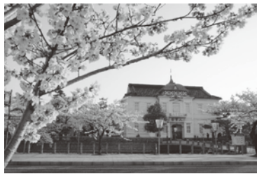
「桜」撮影地：鶴岡公園

このとりくみには、きっかけがありまして訪問入浴の利用者さんがある日「外で花でも見たいわ」とつぶやいたんです。ちょうど桜が満開の時期、鶴岡公園の桜を撮影しプレゼント