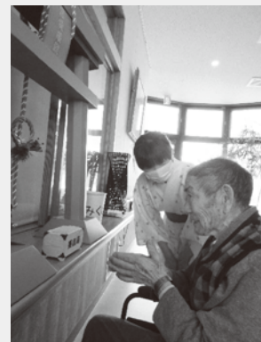
てづくり神社で初詣

定員は特養が29名、ショート2号館が10名で、どちらも個室ユニットケアの施設です。ユニットケアとは、10名位の入居者が家庭に近い環境で、ひとりひとりの希望や生活習慣を尊重した介護をすることです。亡くなったご家族の写真などを居室に置いている方。普段の生活では、毎朝コーンスープを飲みたくてご家族が持参し飲んでいる方。時代劇・韓流・サスペンスと毎日数種類のテレビ番組を視聴している方、がいます。