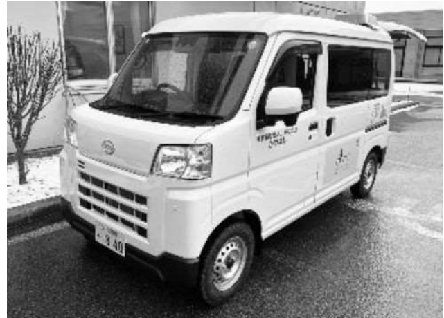
小回りが良く、新・訪問入浴車両を よろしくお願ひします