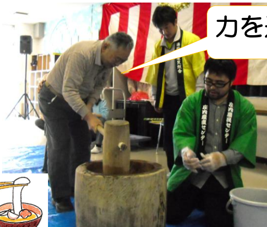
力を込めてヨイショ