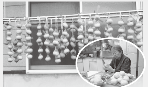
一生懸命むいた柿を干しました